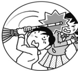
振り回した棒が直撃